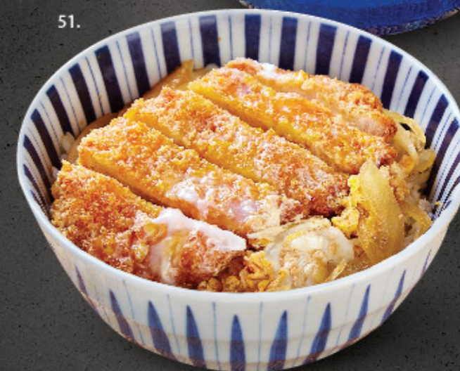
51. 滑蛋吉列豬扒丼 Pork Cutlet Donburi in Creamy Egg Sauce カツ丼 $68