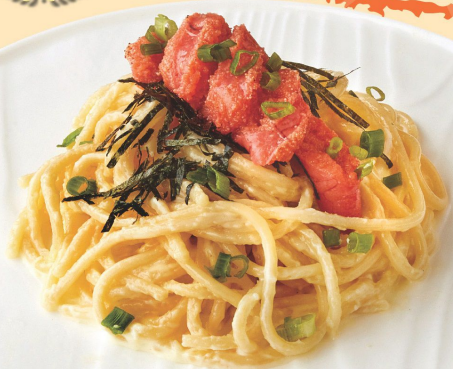
和風明太子忌廉意粉 Spaghetti with Mentaiko in Cream Sauce 和風明太子クリームスパゲッティ $78