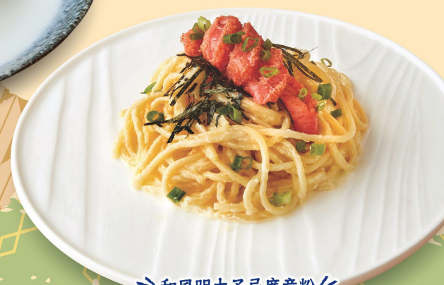
和風明太子忌廉意粉 Spaghetti with Mentaiko in Cream Sauce 和風明太子クリームスパゲッティ $78