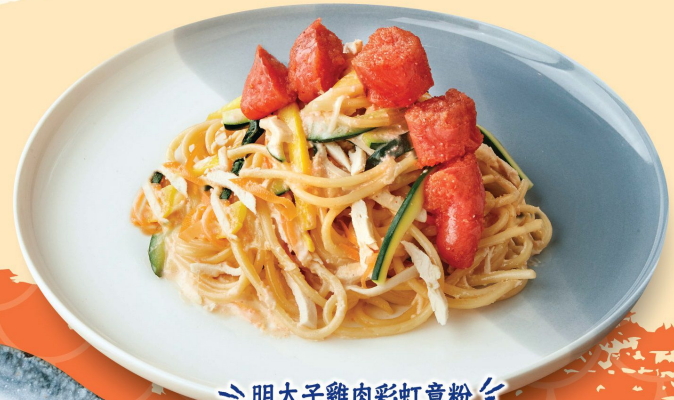
明太子雞肉彩虹意粉 Spaghetti with Mentaiko & Chicken 明太子と鶏ささみのスパゲッティ $98