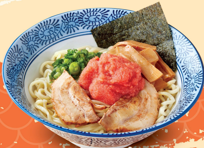
明太子油麵 Mentaiko Aburasoba 明太子油そば $88